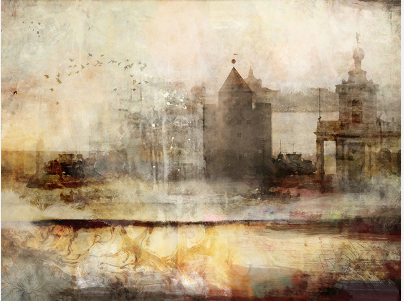
Imagen del congreso

Se presenta el Congreso internacional “La cultura y la ciudad. Imagen y representaciones de lo urbano. Ciudades históricas y eventos culturales” que se desarrollará en Granada entre los días 15 y 17 de Abril de 2015 en la Escuela Técnica Superior de Arquitectura de Granada .