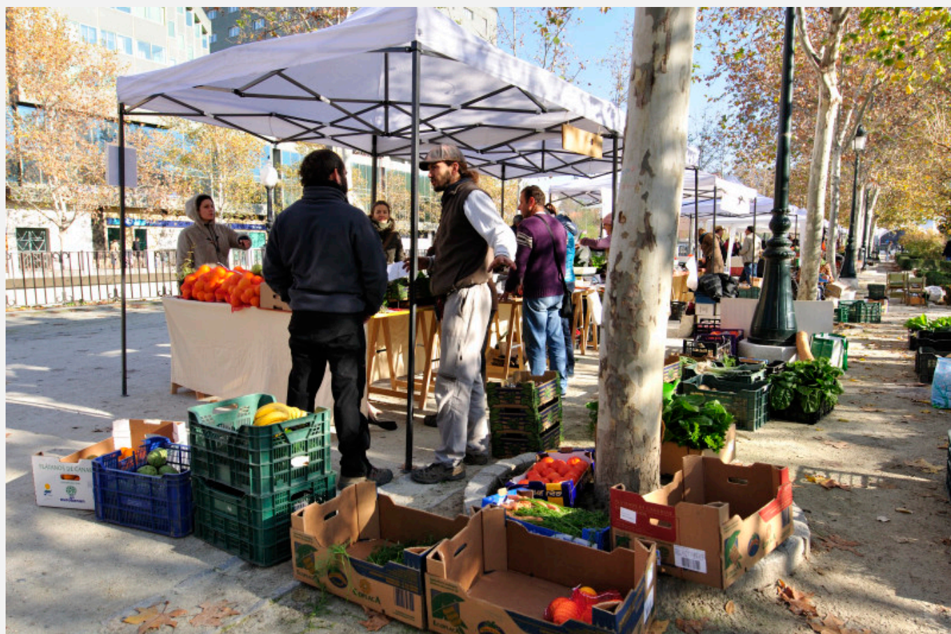
Puesto de El Vergel de la Vega en el Ecomercado de Granada.

Continuamos presentando algunos de los Espacios Emergentes Híbridos de la plataforma. Esta vez nos desplazamos a Granada. Vamos a hablaros de El Majuelo (eeH.G001), de la Biblioteca Social Hermanos Quero (eeH.G002), de la iniciativa