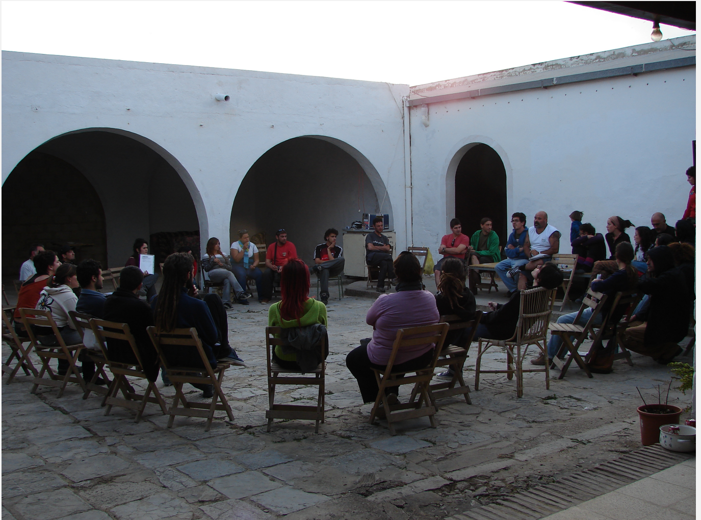
CS El Tendero (ee0c.Ca002)

El Tendedero es una asociación de carácter socio cultural que trabaja por la paz e igualdad social, por una educación y una cultura que promueva los valores, la identidad y la diversidad cultural. Fomentan la participación social y la cultura, la creatividad y la diversidad ya que consideran que no hay libertad posible sin educación y cultura. Trabajan en la creación de redes para luchar por los derechos socioculturales, la lucha contra la pobreza y la exclusión social.