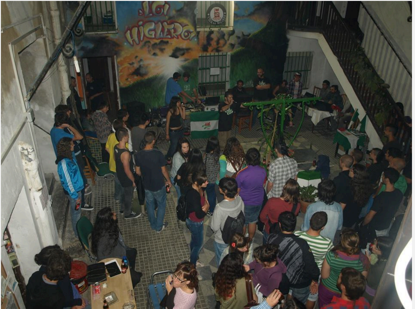
CSOA La Higuera (ee0c.Ca001)

This post is occupied by ee0c located in the provinces of Cádiz, Córdoba and Granada .