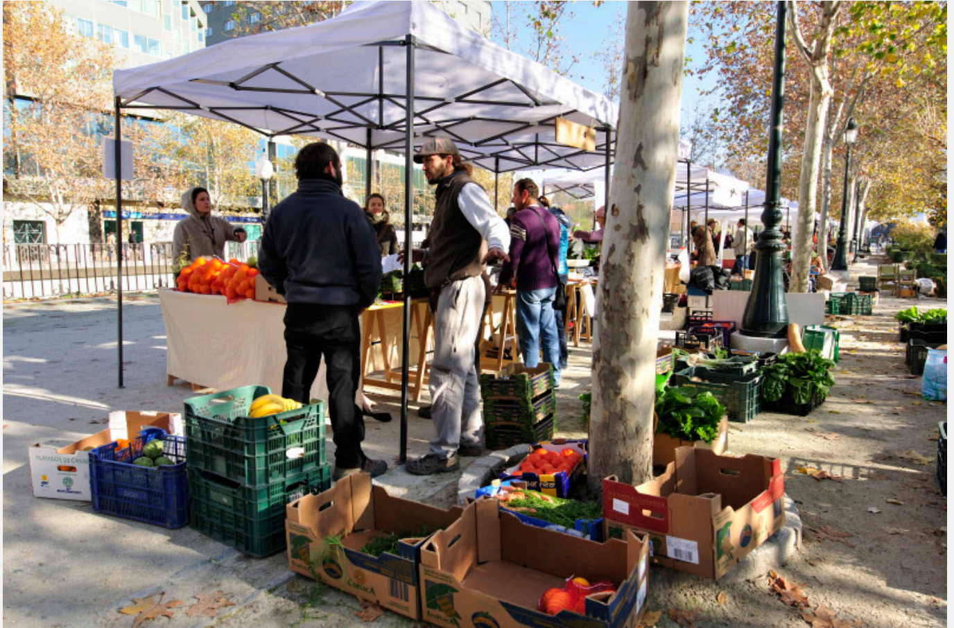
Puesto de El Vergel de la Vega en el Ecomercado de Granada.

Continuamos presentando algunos de los Espacios Emergentes Híbridos de la plataforma. Esta vez nos desplazamos a Granada. Vamos a hablaros de El Majuelo (eeH.G001) , de la Biblioteca Social Hermanos Quero (eeH.G002) , de la iniciativa Con-sumo Cuidado (eeH.G003) , de El Encinar (eeH.G004) , de El Vergel de la Vega (eeH.G005) , de la librería Bakakai (eeH.G006) , de La Casa con Libros (eeH.G007) y por último del Mercado Social y Cultural de Granada (eeH.G009)